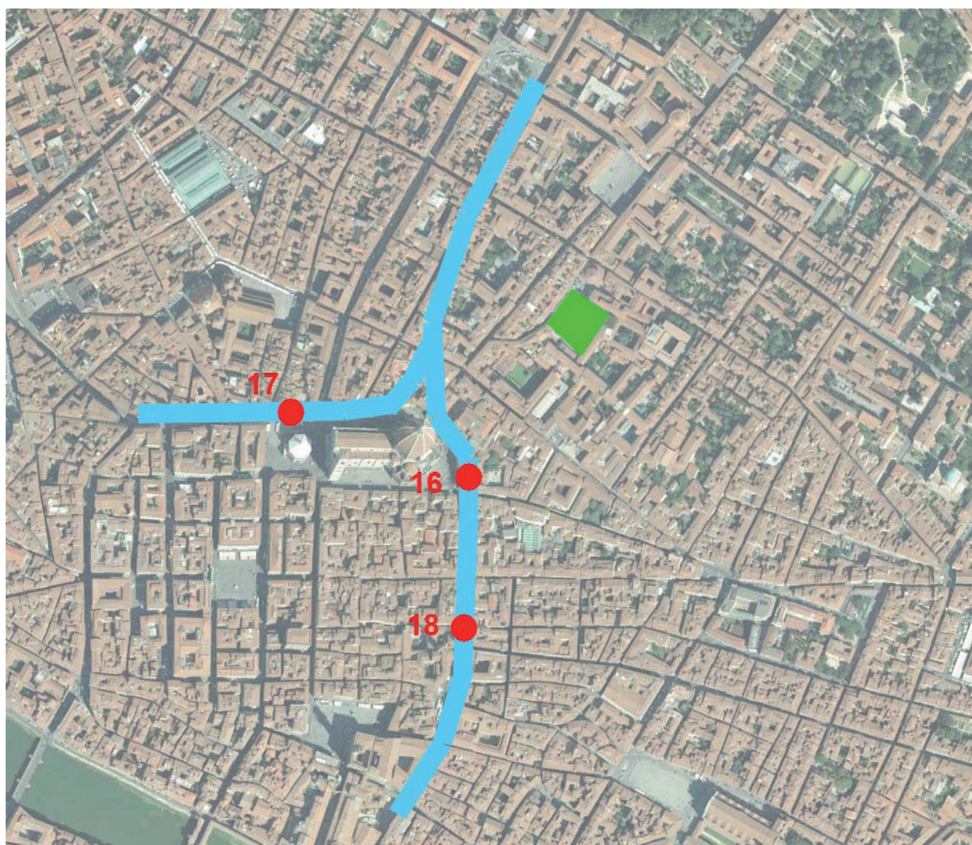
Figura 1. Ricostruzione del corso del canale Scheraggio in base ai dati archeologici. In verde l'area di progetto.

Come si diceva poc'anzi, in prossimità del corso d'acqua si trovavano aree dedicate alla lavorazione dei tessuti. Questi impianti, già esistenti nella seconda metà del Duecento, si trovavano fuori dal perimetro della prima cerchia comunale, ai limiti di un'area scarsamente abitata e interessata dalla presenza di acqua stagnante, localizzabile in corrispondenza dell'attuale Via della Pergola e comprendente anche la zona di Piazza Brunelleschi..