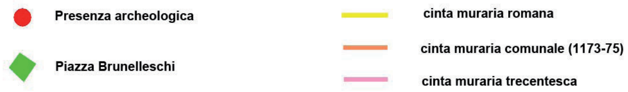
Figura 2 – Posizionamento su foto aerea dei dati archeologici