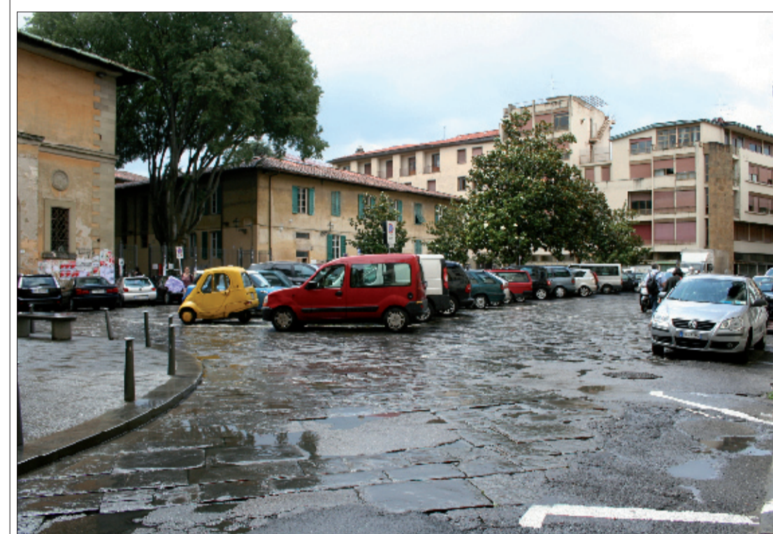
1_vista di Piazza Brunelleschi dall'ingresso di Via degli Alfani