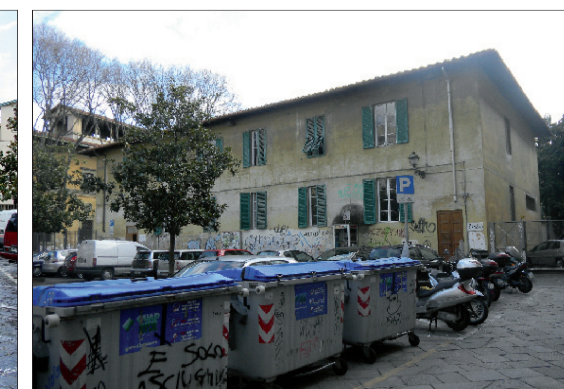
7_Edificio sede del Dipartimento di Costruzioni