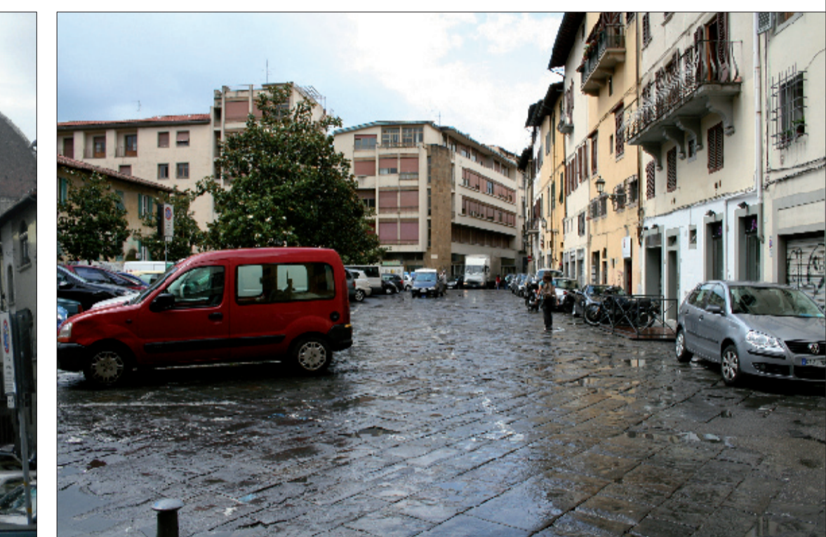
4_vista lungo Via del Castellaccio