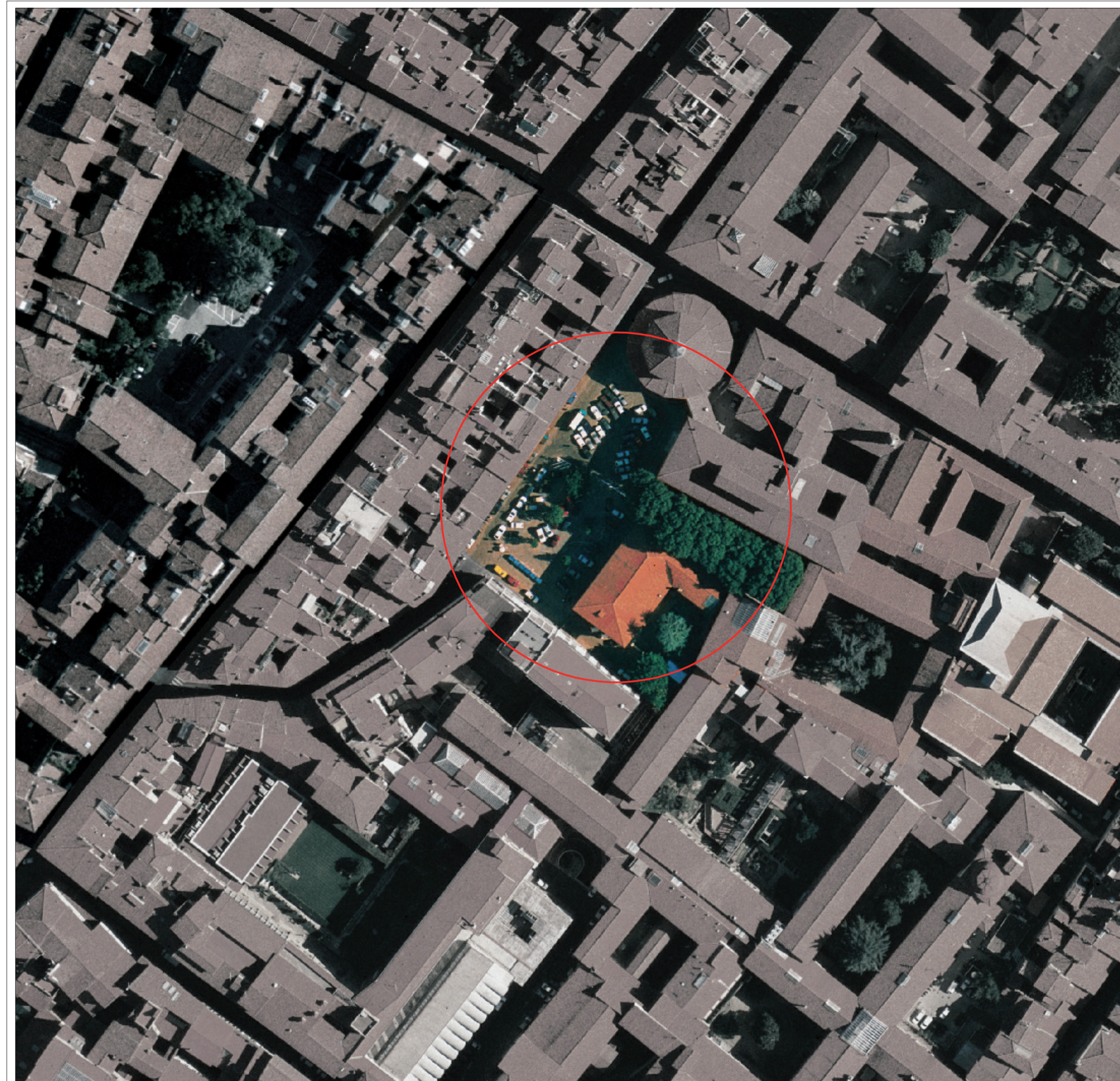
Ortofotocarta (in rosso la zona di intervento)