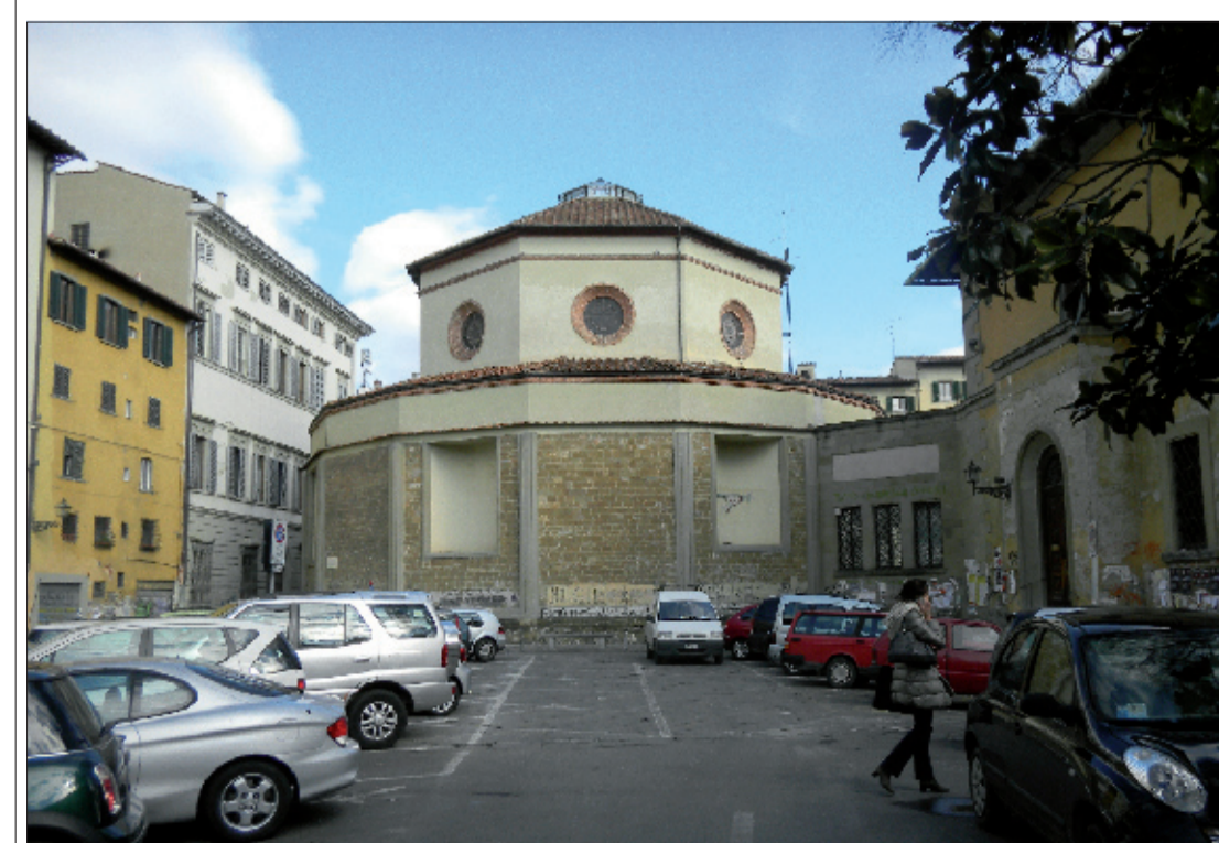
5_vista centrale della Piazza con la Rotonda del Brunelleschi