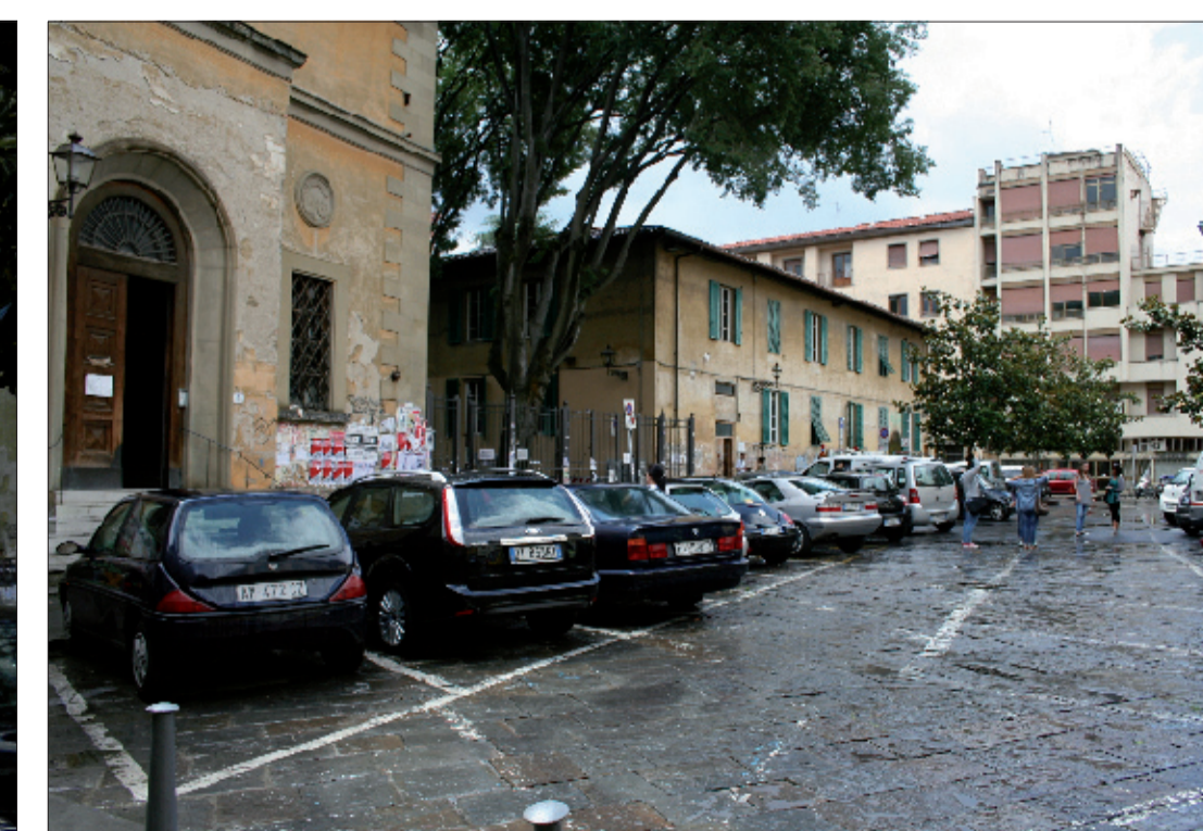
6_vista della piazza da Nord verso gli edifici oggetto di studio