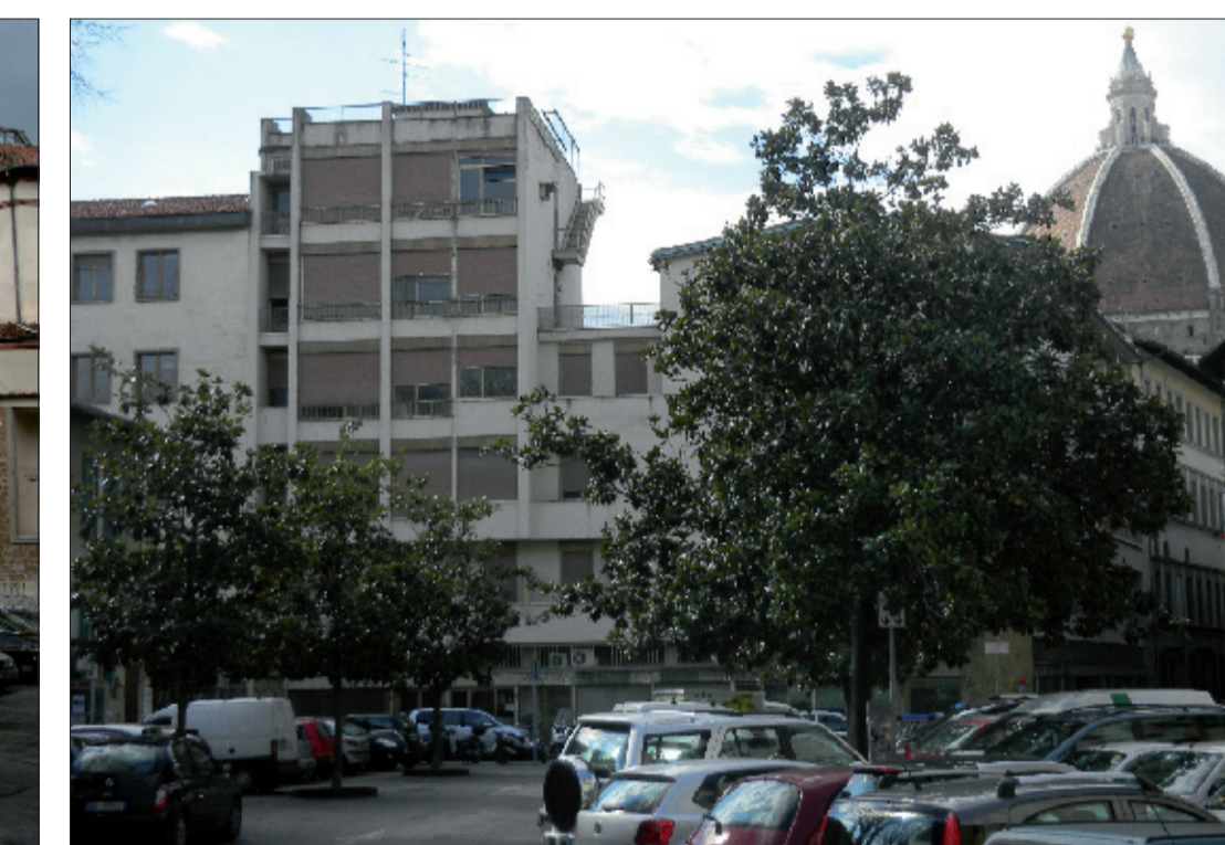
3_vista della Piazza da Nord verso Santa Maria del Fiore