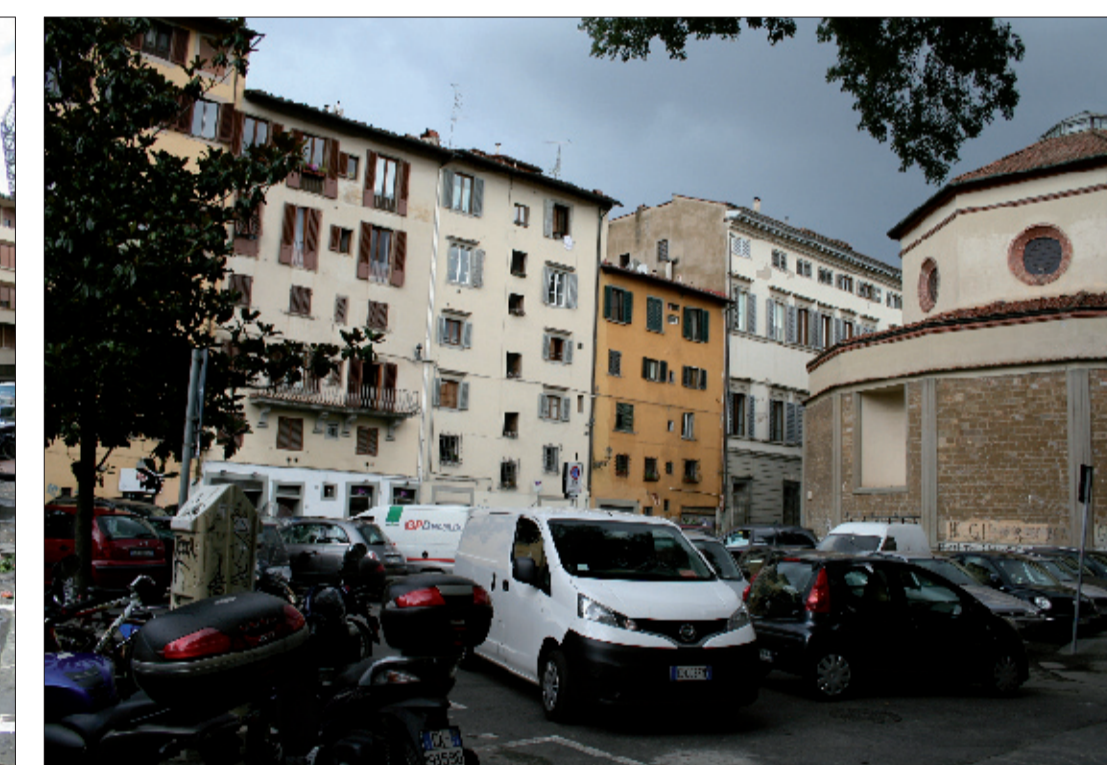
2_vista della Piazza da Sud