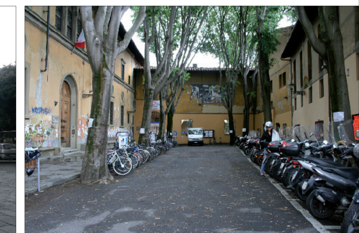
8_Cortile di accesso alla Facoltà di Lettere e Filosofia