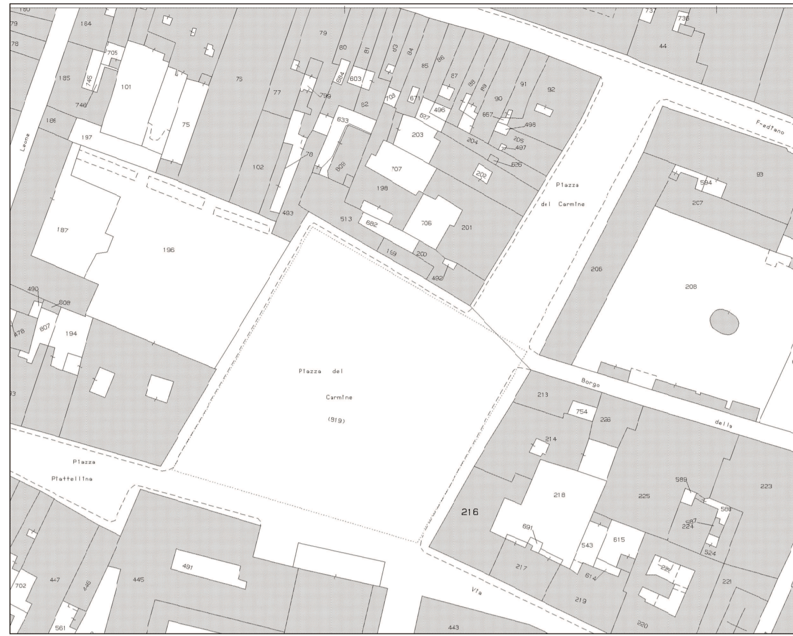
ESTRATTO CATASTO - Scala 1:1000