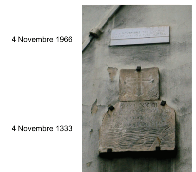
4 Novembre 1966