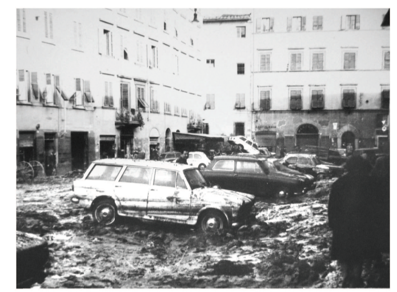
Il ritiro delle acque dopo l'alluvione del 4 Novembre 1966