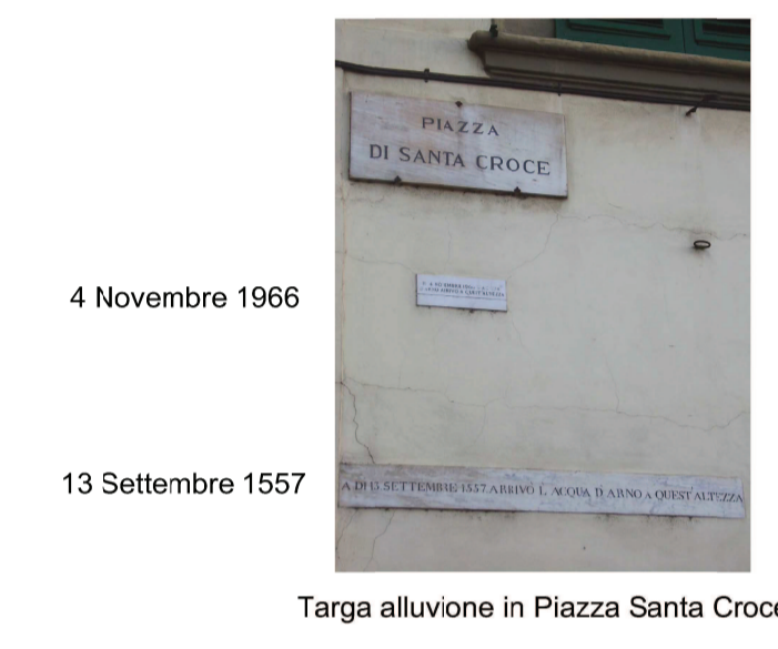
4 Novembre 1966