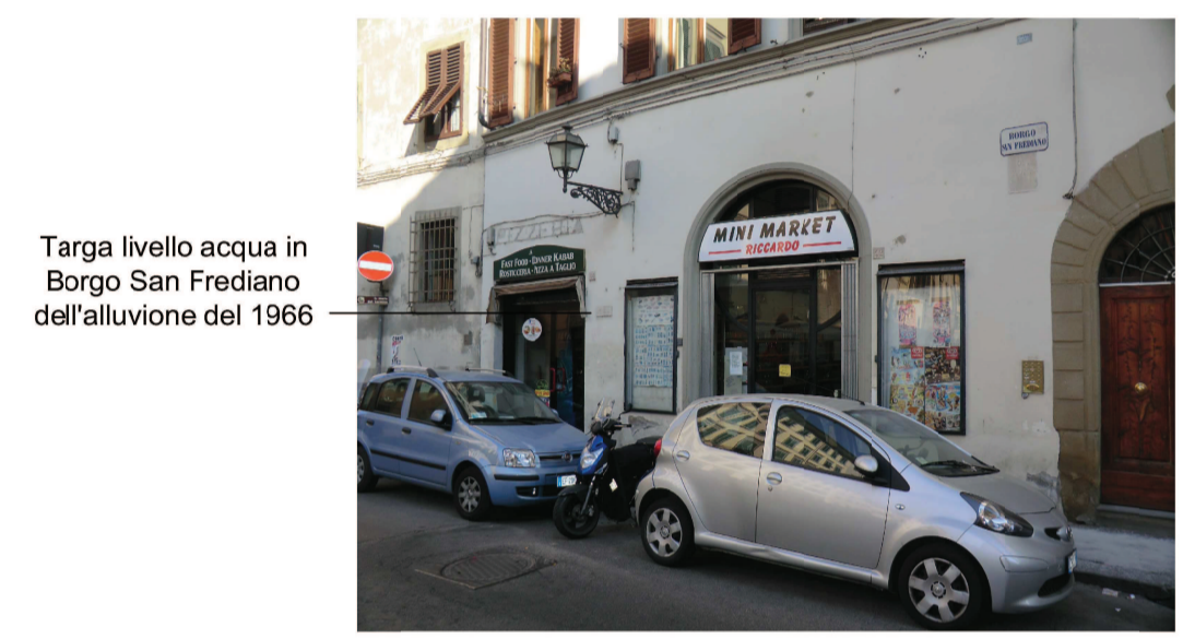
Targa livello acqua in Borgo San Frediano dell'alluvione del 1966